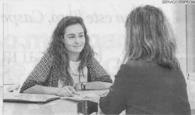
► Una usuaria, atendida en la agencia de colocación de la Fundación DFA.

Tener una discapacidad conlleva mayores dificultades de acceso