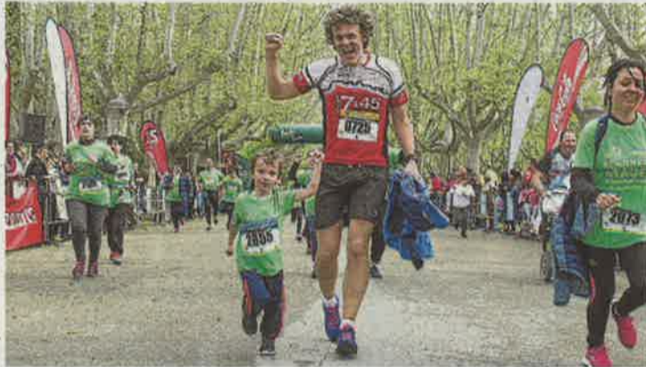
Participantes de la carrera celebrada el año pasado.