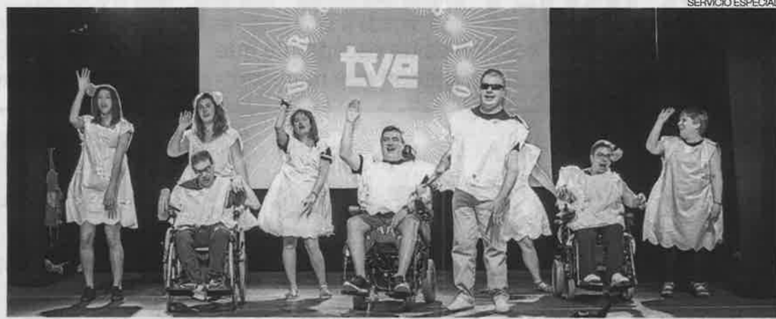
► Usuarios, trabajadores y voluntarios, en la pasada edición del festival de fin de curso de la Fundación DFA.

El espectáculo deleitará al público con actuaciones musicales y obras de teatro sobre una temática en cuestión, realizadas por los propios usuarios y usuarias