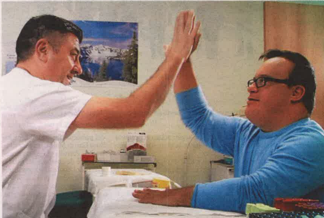
Fotogramas de 'Mi amigo doctor' y el cinecuento 'Despistes y aciertos'. TERAPIAS AUDIOVISUALES