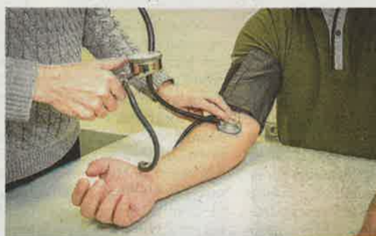
Alumnos practicando en el taller de empleo FIIS ASISTE II.

Los talleres, que están cofinanciados por el Instituto Aragonés de Empleo (Inaem) y el Fondo Social Europeo, comenzaron el pasado 24 de enero y