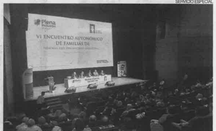
► Un encuentro de familias celebrado por Plena Inclusión Aragón en mayo.

El Encuentro Estatal de Familias 2018 tendrá un formato participativo y dinámico, en el que se incluirán espacios para talleres sobre temas prácticos relacionados con las familias, mesas redondas y debates para reflexionar de forma conjunta, ponencias sobre temas de interés para las familias y paneles con información sobre acciones y actividades diversas.