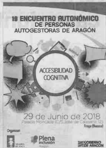
►► Cartel del encuentro de Fraga.

Son personas autogestoras que quieren mejorar su calidad de vida y las condiciones del resto de