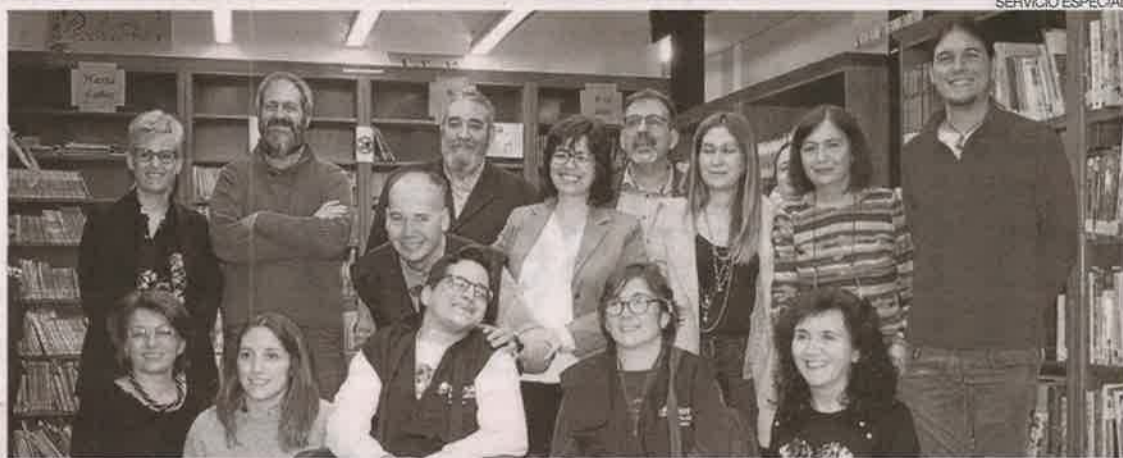
►► El equipo de Plena Inclusión que estudia la accesibilidad, junto a representantes municipales, en la biblioteca.

La accesibilidad cognitiva es que los espacios, servicios, u objetos, sean entendidos con facilidad. La accesibilidad cognitiva es muy importante para las per-