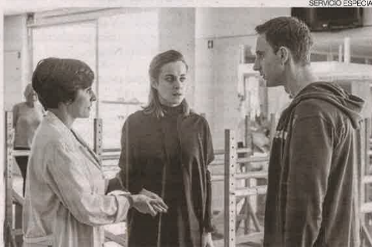
►► Un fotograma de la película '100 metros', protagonizada por Dani Rovira.

100 metros (España, 2016, 102 min) es una comedia dramática