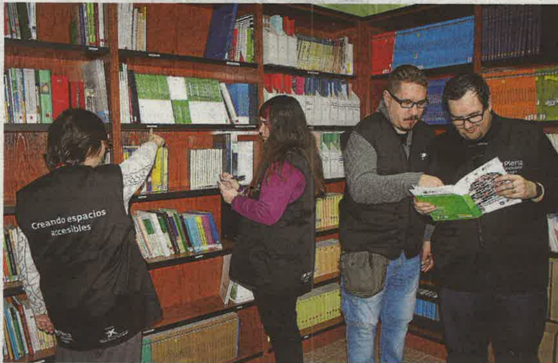
Evaluar si un libro o informe es comprensible o no es una de las tareas de esta comisión.