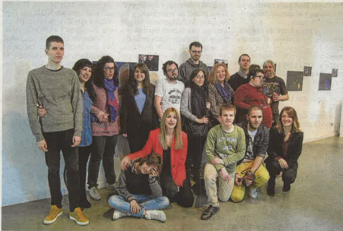
Inauguración de la exposición 'Los sonidos de la gran ciudad', fruto de un innovador taller.

«Hacer salidas nocturnas y escuchar la ciudad emociona. Lo que intentamos conseguir es que se dejen guiar, que disfruten del arte y la belleza que encierra el atardecer, que sepan esperar al momento adecuado para hacer una fotografía y puedan contemplar la vida desde otra perspectiva, la de la tranquilidad de una cámara de fotos», explica, algo que va mucho más allá de «aprender a manejar la exposición, la sensibilidad y el dia-