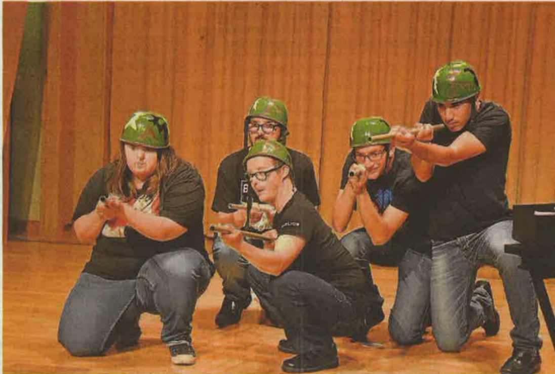
Estreno de 'Segunda gira mundial' (en grande) y algunas escenas de la representación de la primera parte del montaje teatral. FUND. CEDES

La verdadera improvisación, según Miguel, se produce «cuando