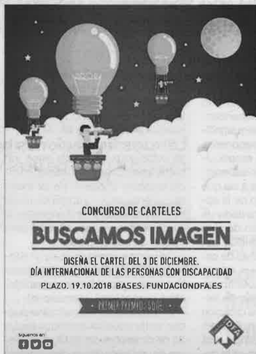
► Cartel anunciador del concurso de carteles.

Se aceptarán obras digitalizadas en formato TIFF o JPG con una resolución de 300 ppp, un tamaño mínimo de 210x297 mm y toda propuesta debe presentarse en formato vertical. El diseño deberá incorporar como elementos imprescindibles los conceptos: 3