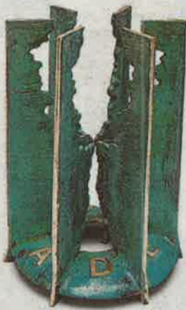
Escultura del premio. ATADES

A estos galardones pueden optar tanto las personas físicas como jurídicas, públicas o privadas, siempre que tengan nacionalidad española y que desarrollen su actividad en el país. En la primera categoría, la que recompensa los proyectos de mejora de calidad de vida de las personas, estos deberán estar destinados específicamente al colectivo de la discapacidad intelectual. El ganador se llevará un premio de 3.000 euros y una escultura de Florencio de Pedro.