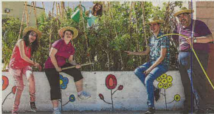
Usuarios del centro que la Asociación Utrillo gestiona en Zaragoza.