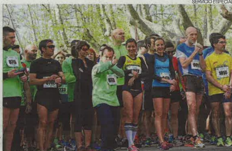
►► Salida de la carrera el año pasado en el parque José Antonio Labordeta.