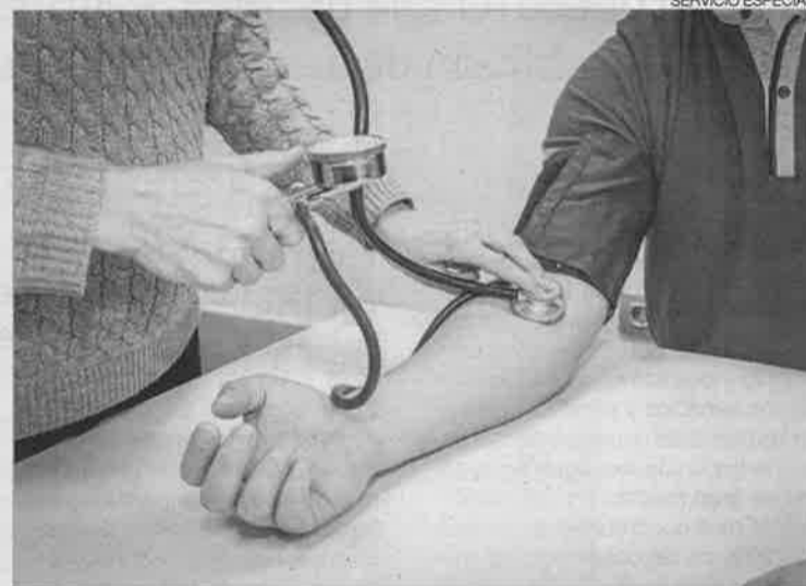
► Alumnos practicando en el taller de empleo FIIS ASISTE II.

La mayoría de los alumnos y alumnas formados se incorporan a la fundación y también se media en la contratación para su colocación en otros centros asistenciales.