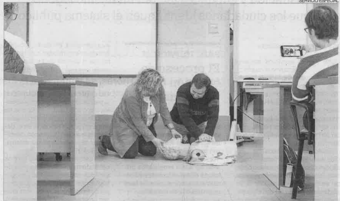
► Alumnos realizando una formación práctica en el taller FIIS ASISTE II de la Fundación DFA.

Durante el transcurso del taller, el alumnado ha desarrolla-