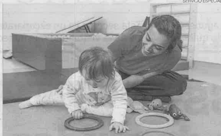
► Sesión en el centro de desarrollo infantil de la Fundación DFA.