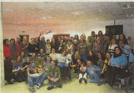
Foto de los asistentes a la gala celebrada la pasada semana.

«El voluntariado es el protagonista de nuestras mejores películas» expresaron los trabajadores de Fundación de manera emotiva a los volunta