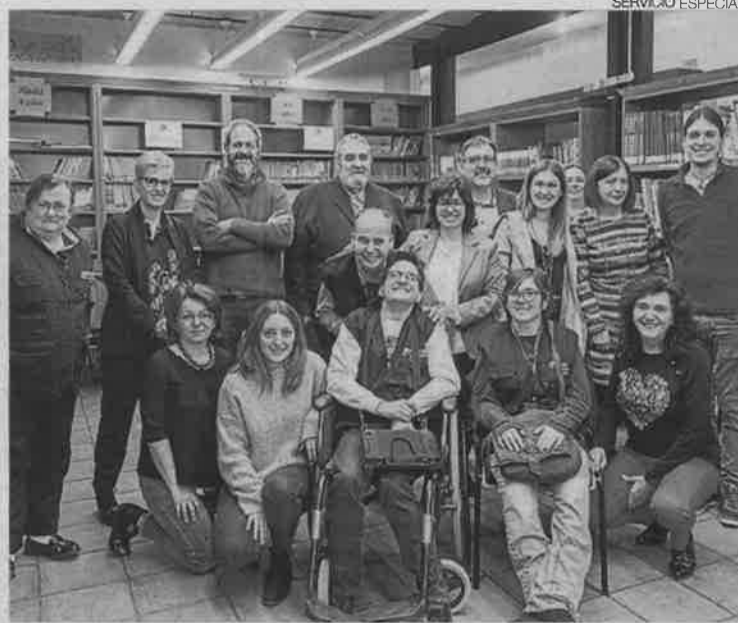
►► La biblioteca de La Almunia es un espacio accesible cognitivamente.

Estas personas con discapacidad intelectual forman parte de una comisión que se llama Crea-