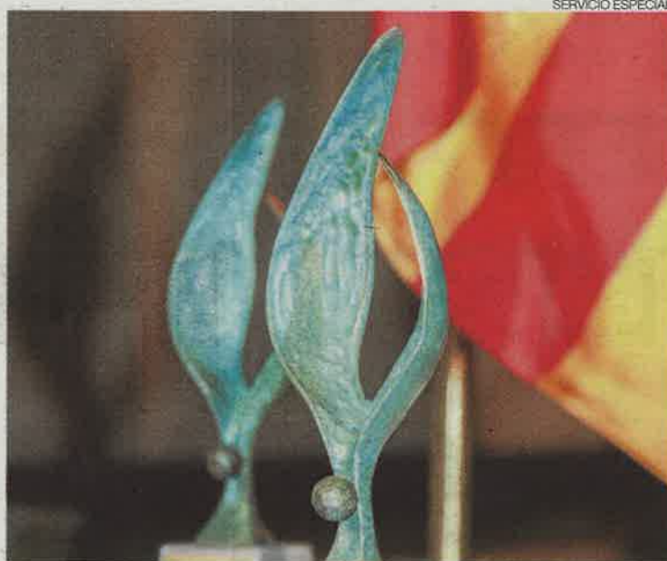
►► Detalle de la estatuilla que se entrega a los premiados por DFA.