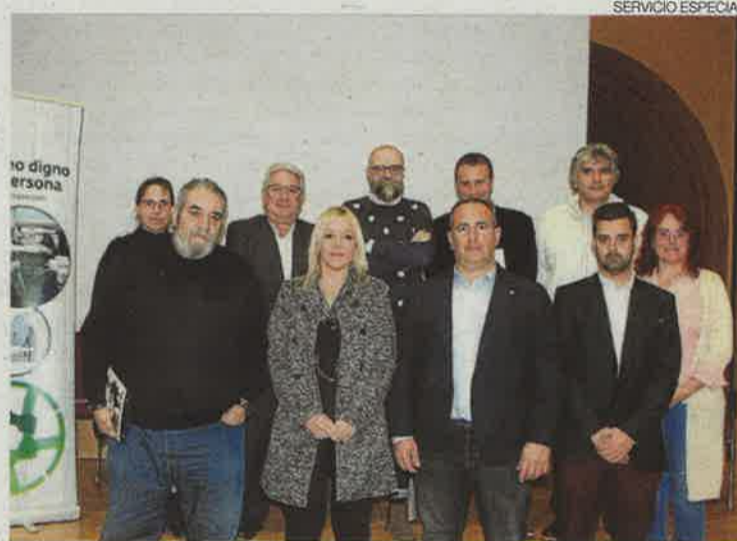
►► El grupo que se reunió en Sariñena la semana pasada.