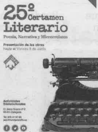
► Cartel del 25º concurso literario.

En la primera categoría, narrativa, el tema es libre y con una extensión máxima de 5 folios; en la categoría de poesía, el tema es libre, sin límite de extensión; y en la modalidad de microrrelato, se deberán enviar obras relacionadas con el Mundo DFA (accesibilidad, discapacidad, dependen-