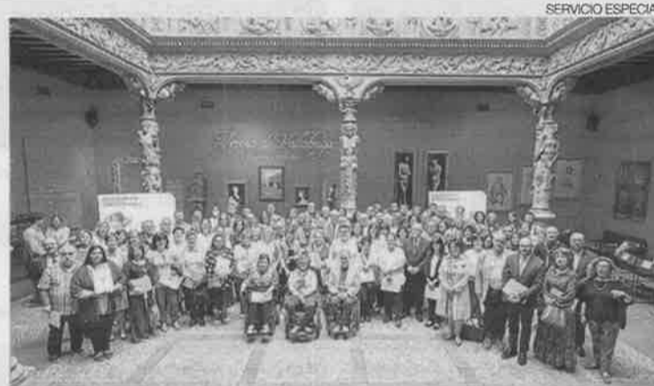
►► Representantes de las entidades sociales de Zaragoza y provincia.

ambas fundaciones han dedicado a este fin casi 2 millones de euros en la comunidad autónoma aragonesa.